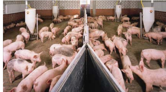
Mit VILO-Vital gefütterte Ferkel zeigen ein hohes Leistungspotential.